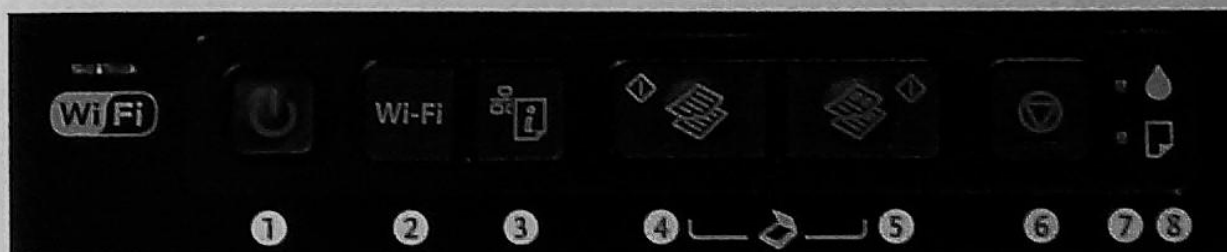
Rys. 75.2. Panel sterowania urządzenia wielofunkcyjnego atramentowego

1 – włącznik, 2 – funkcja Wi-Fi, 3 – funkcja sieci, 4 – kopiowanie mono, 5 – kopiowanie kolorowe, 6 – anulowanie akcji, 7 – brak tuszu, 8 – brak papieru