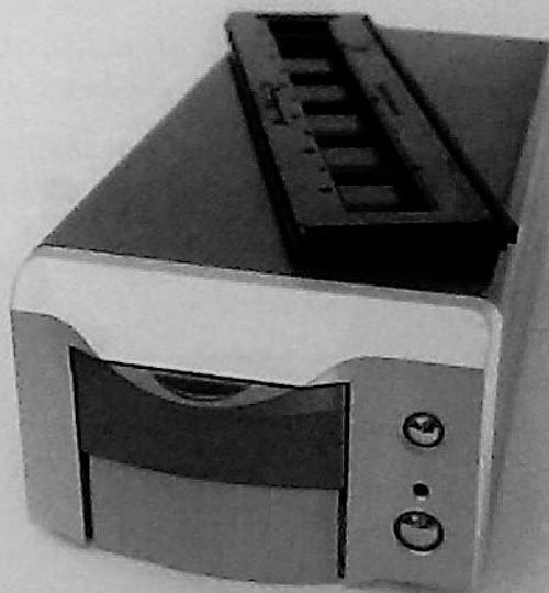
Rys. 74.6. Skaner slajdów