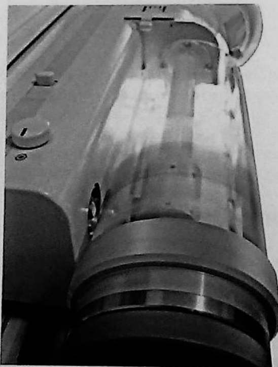
Rys. 74.5. Skaner bębnowy

Skaner bębnowy (ang. drum scanner ) umożliwia skanowanie oryginałów przezroczystych, slajdów, negatywów. Skanowany oryginał umieszcza się na bębnie, który obraca się z prędkością do ponad 1500 obrotów na minutę. Skanery te znajdują zastosowanie głównie w profesjonalnych studiach graficznych, gdzie liczy się wysoka jakość skanowanych obrazów. Skanery bębnowe uzyskują rozdzielczość do kilku tysięcy dpi, przy której ze slajdu 35-milimetrowego można uzyskać obraz do wydruku w formacie A3.