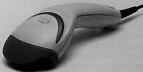
Rys. 74.2. Skaner ręczny

To typ skanera obsługiwany ręcznie, którego głowica jest przesuwana nad skanowanym dokumentem. Jest to niewygodna metoda skanowania – przy większych obszarach konieczne jest skanowanie po fragmencie oryginału. Obraz zeskanowany jest często nierówny i poszarpany, trudno też dopasować skanowane oddzielnie dokumenty. Skanery te mają jednak ogromną zaletę. Umożliwiają skanowanie powierzchni niedostępnych dla innych skanerów, np. wzoru na ścianie czy okleiny na meblach. Ich maksymalna rozdzielczość to zwykle 400 dpi.