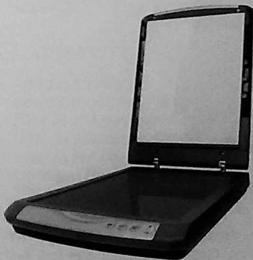
Rys. 74.3. Skaner płaski

Najpopularniejszy typ, w którym do skanowania używa się lampy przesuwającej się pod szybą. Dokument lub grafikę do zeskanowania należy przyłożyć właściwą stroną do szyby skanera. Poruszająca się pod szybą lampa przekazuje obraz do przetworzenia. Skanery te są wykorzystywane głównie do pracy biurowej lub w domu do zastosowań profesjonalnych. Często są wyposażone w przystawki do skanowania negatywów slajdów. Rozdzielczość tych skanerów wynosi od 300 x 600 dpi do 2400 x 4800 dpi.