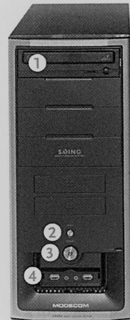
Rys. 98.1. Jednostka centralna (przód)

To dla użytkownika jeden z ważniejszych dokumentów stanowiska. W dokumentacji należy zawrzeć dokładny opis budowy jednostki. Musi ona także obejmować informację o tym, jakie urządzenia i gdzie można podłączyć.